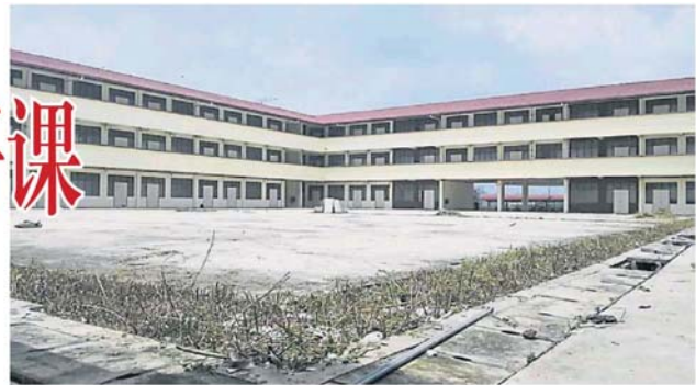
天空逾 2 年的新城华小。