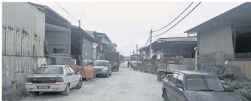
雪州从 2006 年起, 连续 6 次延续推动不合格工厂漂白计划。(档案照)

“工厂若不合格及无法合法化经营, 在各项贷款申请、贷款、购买保险及聘用外籍人士等方面也会面对各种问题, 因此, 合格及合法化对业者绝对利多于弊。”