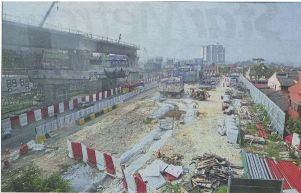
A view of one of the MRT2 construction sites along Jalan Raya Satu in Serdang Jaya.

Provided for client's internal research purposes only. May not be further copied, distributed, sold or published in any form without the prior consent of the copyright owner.