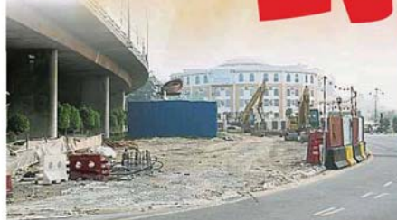
五条路交通圈已成为轻快铁第三路线的工地范围。

轻快铁第三路线 (LRT3) 单位与项目总承包商马资源乔治特私人有限公司 (MRCB George Kent) 日前发布媒体声明, 基于轻快铁施工需要, 上述支路将从今日起至12月31日间歇性 (intermittent) 关闭3个月。