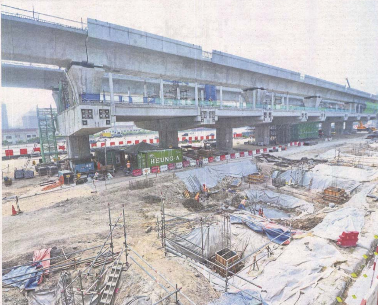
Massive project: The MRT2 line is expected to serve a two-million population and spans a distance of 52.2km with 35 stations.

The MRT2 line's project delivery partner says frequent flooding faced by residents near its construction sites, especially in Seri Kembangan, is a pre-existing problem and comprehensive mitigation measures have been taken. >2&3