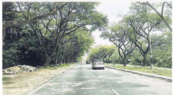
■工程局建议,把脚车道及跑道建设在路边的道路保留地,而非在马路上。