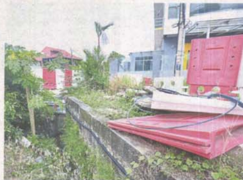
Construction hoarding and material too close to existing premises along Jalan Raya Satu in Serdang Jaya

He added that the flooding along the bridge crossing Sungai Kuyoh was not due to the construction as it was outside the MRT2