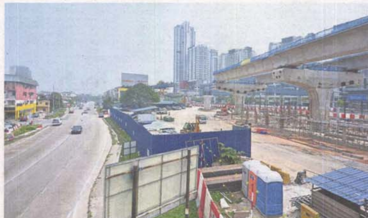
Also known as MRT2, the SSP Line is progressing ahead of schedule.

A flood mitigation plan was also outlined with measures that included the enlargement of the Sri Serdang pond (Andalas pond) and upgrading of Sungai Kuyoh.