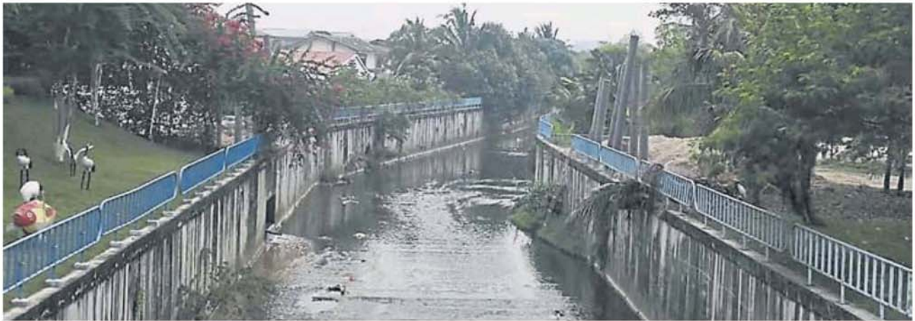
进出加影福建义山的新路横跨直鲁河。