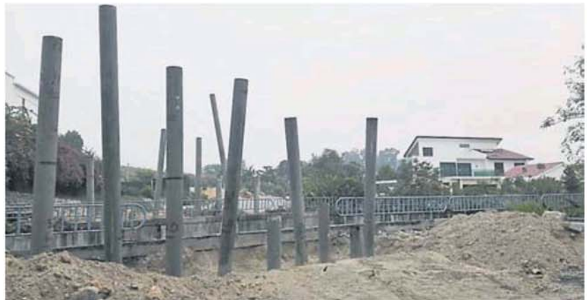
桥梁和新路的打桩工程已进行。