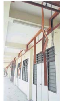
新城华小的电线今年初被偷。

他说, 若在 12 月之前拿到住用证, 教育部有 1 个月的时间准备开课, 若处理不到就要等到 3 月, 他们尽量做。