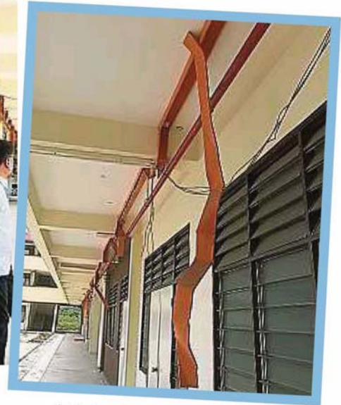
窃贼在3月潜入校园将电线盗走，损失不菲，建委会获教育部拨款后，会积极解决。