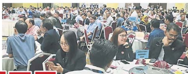
“雪州非法工厂合规条款与执法行动”, 吸引不少商家踊跃出席了解申请把工厂合法化的事宜。