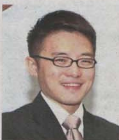
Wong says maintenance of Jalan Besar stopped when MRT project started

Project management: Steps in place to ensure MRT construction does not exacerbate problem