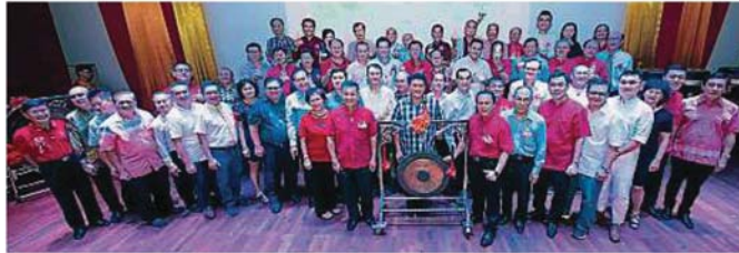
← 众志成城，八打灵发展华小逾25万令吉活动为鸣锣、擂鼓及剪彩者在开幕仪式后合影。