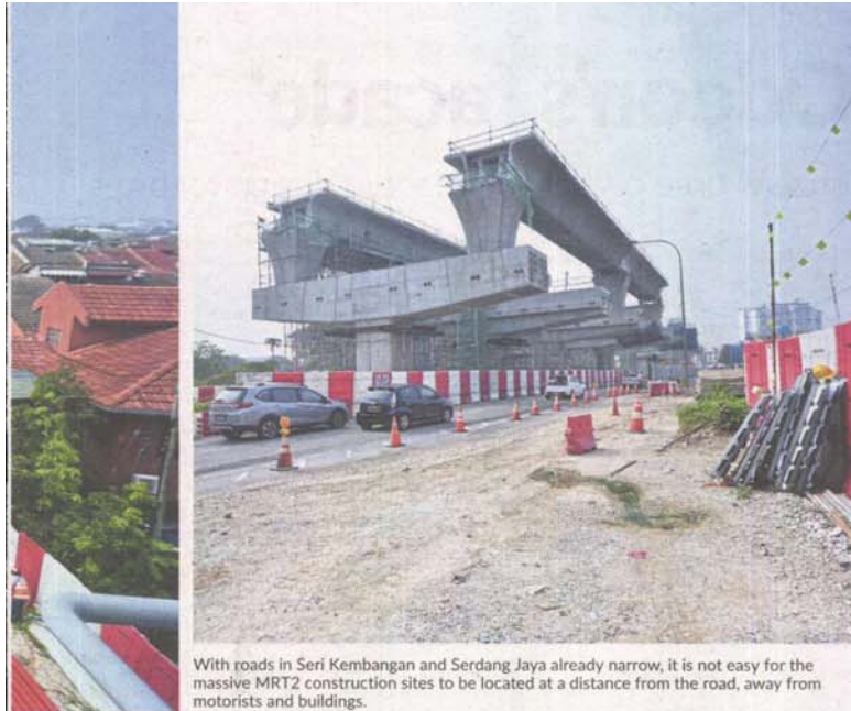
With roads in Seri Kembangan and Serdang Jaya already narrow, it is not easy for the massive MRT2 construction sites to be located at a distance from the road, away from motorists and buildings.

Provided for client's internal research purposes only. May not be further copied, distributed, sold or published in any form without the prior consent of the copyright owner.