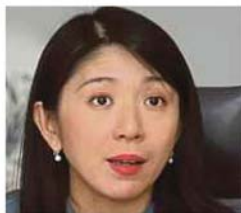
Yeo Bee Yin

Bee Yin berkata, akta itu tidak hanya tertumpu kepada masalah membabitkan jerebu tetapi juga pencemaran lain bagi membolehkan kerajaan bertindak terhadap syarikat atau rakyat Malaysia yang melakukan kesalahan di luar negara sehingga mengakibatkan pencemaran di negara ini,