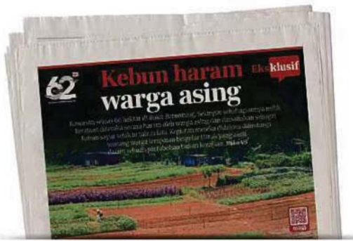
Keratan akhbar BH pada 8 September lalu.

"Beberapa agensi antaranya Majlis Daerah Hulu Selangor (MDHS), Tenaga Nasional Ber-