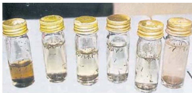
■ 双溪威新村管委会举行消灭黑斑蚊，数个瓶内是寻到的蚊虫。

蚊雾就能预防病例，若长期喷射蚊雾，久而久之会让黑斑蚊免疫；真正要杜绝黑斑蚊滋生，就要把家园清理干净，环境卫生才是重要措施。